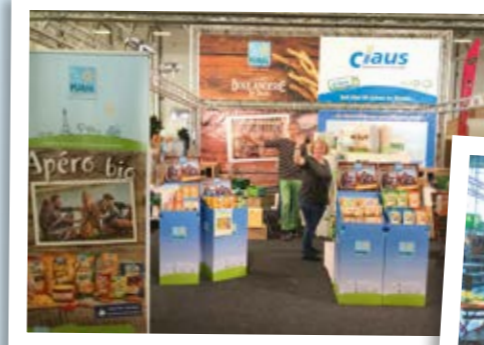
Unser Stand auf der BioSüd – mit den neuen Pural-Displays (Augsburg, 01.10.2017)

Mit herzlichen, vorweihnachtlichen Grüßen