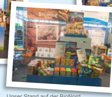
Unser Stand auf der BioNord (15.10.2017)