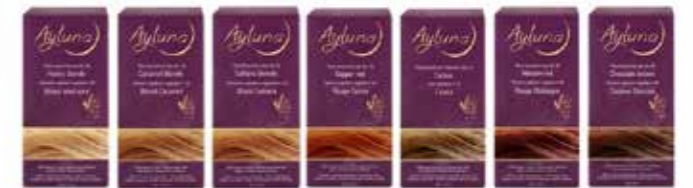
Ayluna Pflanzenhaarfarben sind auch für sehr empfindliche Menschen geeignet.

„Ich bin überzeugt von den Pflanzenhaarfarben von Ayluna. Sie haben einen hohen Alleinstellungswert. Alle vermahlenden Pflanzenstoffe sind 100% Bio, das ist einzigartig! Ich habe schon viele positive Rückmeldungen bekommen.“