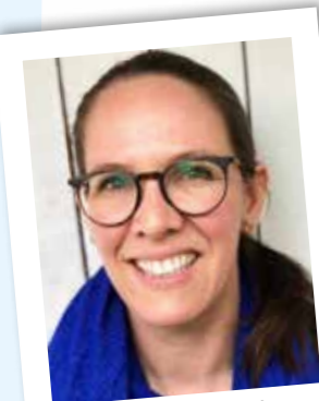
Rebecca Kramer sonett GmbH